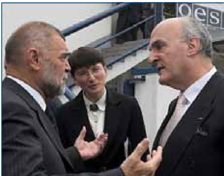
Predsjednik Mesić kaže kako se bliži kraj razdoblju monitoringa.

Dozvolite mi, da u vezi s time, stvari postavim na mjesto kamo pripadaju. Republika Hrvatska izuzetno cijeni ulogu što je Organizacija za evropsku sigurnost i suradnju igra u širim evropskim okvirima. Ali, mi jednako tako cijenimo i ulogu koju je