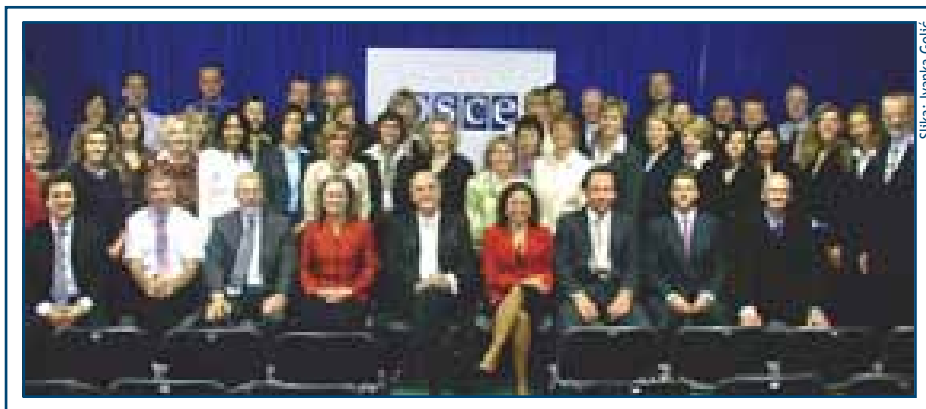
Slika: Ivanika Golčić

Od 1995. godine, kada je prvobitna Konferencija pretvorena u organizaciju, pozornost