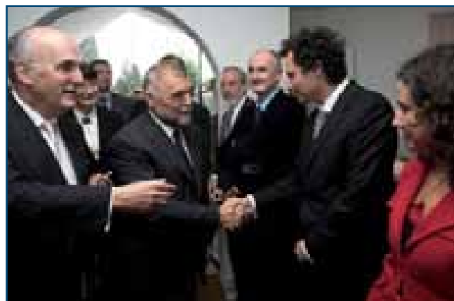
Slika: Tomislav Pavlek

Predsjednika Hrvatske Stjepana Mesića pozdravljaju s cvijećem u Glavnom uredu Misije članice obitelji uposlenika OESS-a – Mimi Fawcett i Katarina Sams.