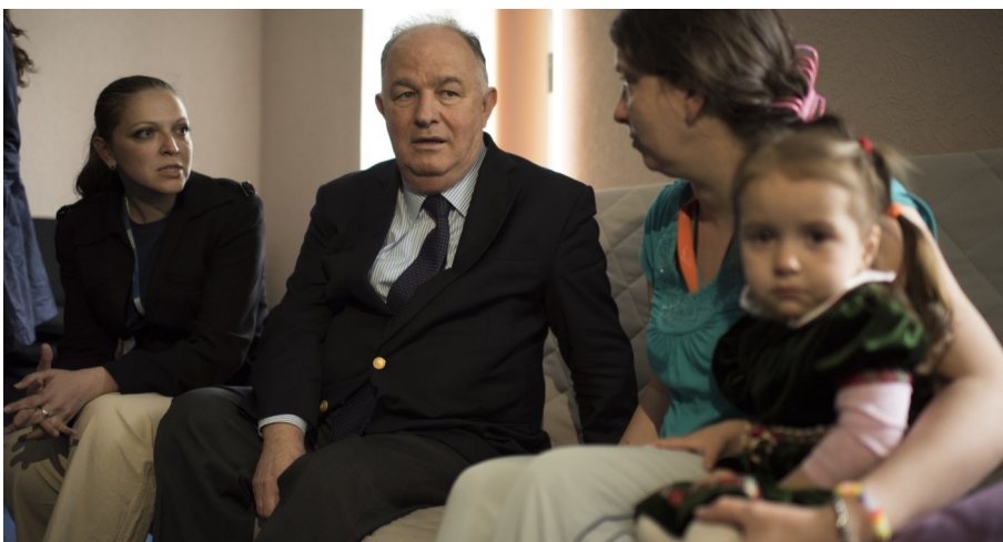
Глава СММ посещает центр для внутренне перемещенных лиц в Славянске, май 2015