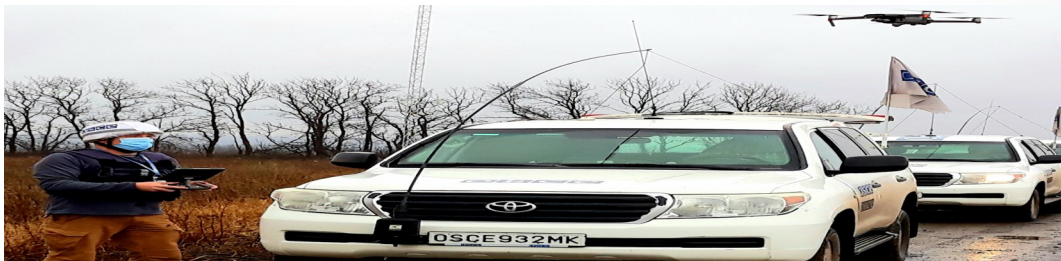
Патруль СММ здійснює моніторинг ділянки розведення № 3.