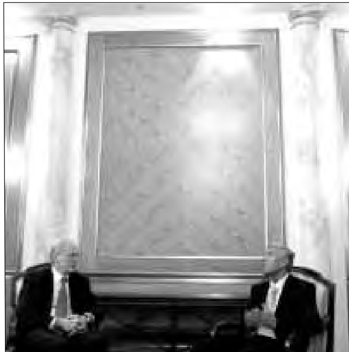
Ambasadori Kai Aide në vizitën e fundit Kosovës dhe Beogradit

Në javën e dytë të shtatorit ka pasur akuza të shtuara për korrupsion kundër Kryeministrit Kosumi dhe qeverisë së tij, me kërkesa për dorëheqjen e tij, dhe duke arritur kulminacionin me parashtrimin e mocionit për interpelancë formale nga një parti opozitare në Kuvendin e Kosovës. PDK-ja ka për qëllim t’i parashtrorë pyetje Kryeministrit për shfrytëzimin e aeroplanit privat me të cilin u kthye në Kosovë pas pushimit në Turqi. Z. Kosumi i ka mohuar keqbjërjet, duke thënë se shfrytëzimi i aeroplanit është ofruar si favor nga Ministri i energjisë dhe minierave Ethem Çeku në mënyrë që z. Kosumi të kthehej me kohë në Kosovë për t’u takuar me të dërguarin e posaçëm Kai Eide. Sipas opozitës, shfrytëzimi i aeroplanit nga z. Kosumi shkel ligjin kundër korrupsionit, sipas të cilit personat zyrtarë nuk mund të pranojnë dhurata në vlerë më të madhe se 50 EUR.