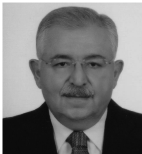
Тахсин Бурджуоглу (Туреччина)

Вона займала пост Міністра закордонних справ (2006-2009) та діючого Голови ОБСЄ в 2009 році. Раніше, вона була обрана першою жінкою - мером Афін (2003-2006), призначалася Міністром культури (1992) і заступником державного секретаря (1990). У 2009 році Дора Бакоянні була обрана першою жінкою - іноземним член-корреспондентом Академії гуманітарних і політичних наук Франції та почесним сенатором Європейської академії наук і мистецтв. Перед початком політичної кар'єри вона працювала в департаменті у справах Європейської Економічної спільноти в Міністерстві економічного співробітництва.