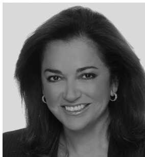
Дора Бакоянніс (Греція)

Посол Ішингер є Головою Мюнхенської конференції з безпеки. До цього призначення, він був Послом Німеччини у Великій Британії (2006-2008) та у Сполучених Штатах (2001-2006), а також заступником Міністра закордонних справ Німеччини (1998-2001). У 2007 році він представляв Європейський союз у Трійці на переговорах про майбутнє Косово. У 2014 році він виконував функції Спеціального представника діючого Голови ОБСЄ, для просування та сприяти національного діалогу під час Української кризи. Він є членом як Тристоронньої комісії так і Європейської ради з зовнішніх справ, а також входить до ради директорів багатьох неприбуткових організацій, у тому числі СІПРІ.