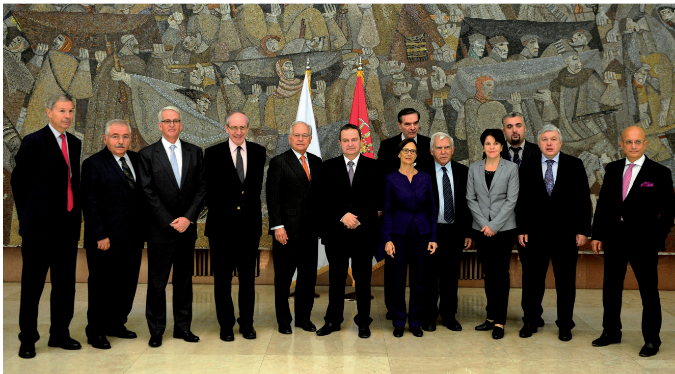
Діючий голова ОБСЄ, перший заступник Прем'єр-міністра і міністр закордонних справ Сербії, п. Івіца Дачич з членами Групи Мудреців з питань європейської безпеки як спільного проекту. Белград, 2 жовтня 2015 р.