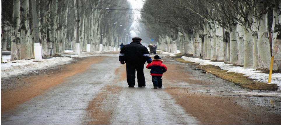
Люди на вулиці в невідконтрольному урядові Гольмівському, Донецька область