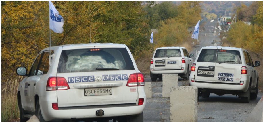
СММ ОБСЄ під час патрулювання між Золотим і Первомайськом, 10 жовтня 2017 року.