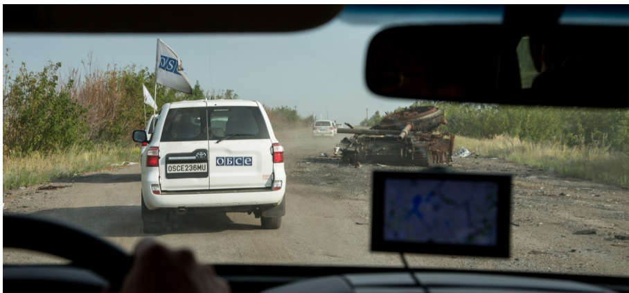
Патруль СММ прямує автошляхом М03 між Світлодарськом і Дебальцевим, 8 серпня 2017 року.