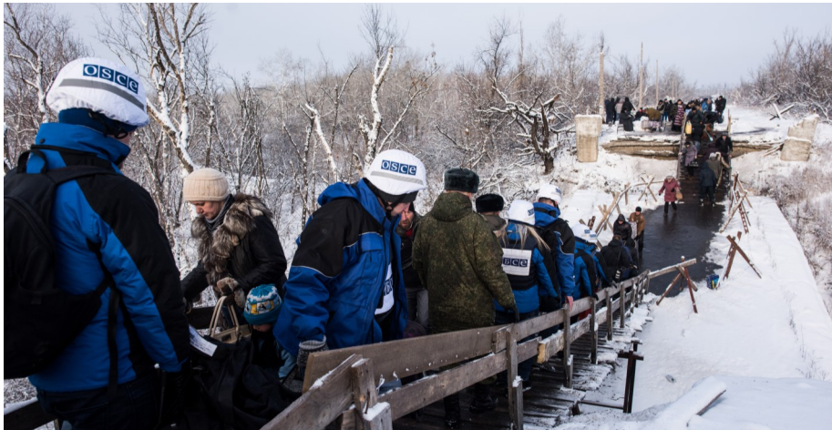
Наблюдатели ОБСЕ пересекают линию соприкосновения в районе Станицы Луганской — единственный официальный КПВВ в Луганской области, 16 декабря 2016 года.