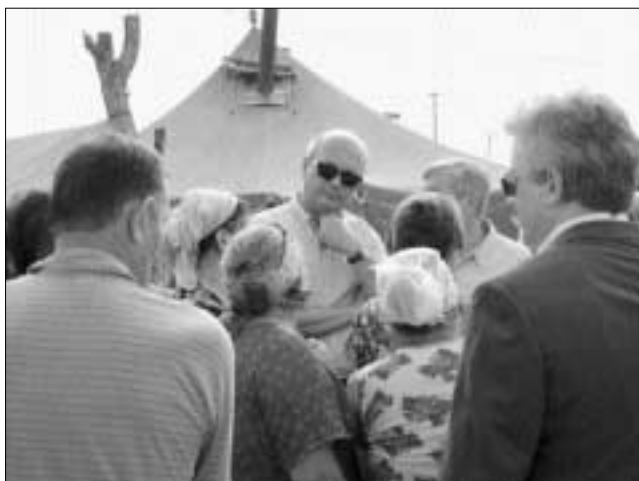
Посол Жерар Студман во время посещения лагеря для временно перемещенных лиц в Знаменском

сможем помочь им найти решение существующих здесь проблем». Как он, так и его коллега сержант Стивен Бодди уже бывали в Македонии раньше, в ходе осуществления проекта БДИПЧ по реформированию полицейской академии.