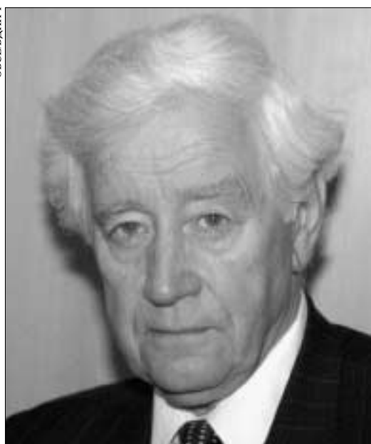
1 июля шведский дипломат Рольф Экеус приступил к работе в качестве нового Верховного комиссара.

нов многоэтнических государств... Завершившееся столетие и даже десятилетие послужили для нас достаточным предупреждением относи-