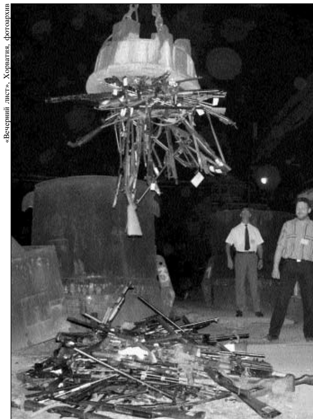
В Хорватии начало Конференции ООН по легкому оружию было ознаменовано мероприятиями правительства по уничтожению крупных партий оружия.

На практикум прибыли эксперты из различных стран, а также сотрудники ОБСЕ и НАТО. Генеральный секретарь ОБСЕ Ян Кубиш проинформировал участников о достигнутом прогрессе и настоятельно призвал государства-участники в максимально короткие сроки выполнить взятые ими на себя на национальном уровне обязательства. Он также приветствовал более широкое сотрудничество с СЕАП и призвал участвующие организации сотрудничать с правительствами принимающих стран в разработке «пилотных» проектов на местах.