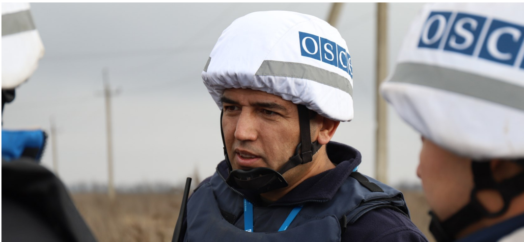
Наблюдатели СММ вблизи участка разведения в районе Петровского, Донецкая область