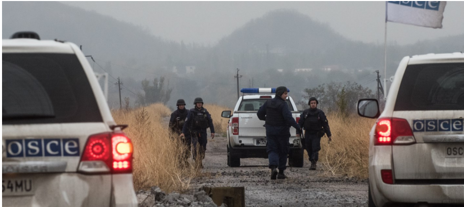
СММ ОБСЕ способствует установлению локального режима прекращения огня и осуществляет мониторинг его соблюдения, что позволило выполнить работы по разминированию в районе газораспределительной станции возле Марьинки.