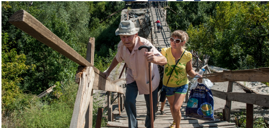
Перетин зруйнованого мосту в Станиці Луганській, 19 липня 2017 року