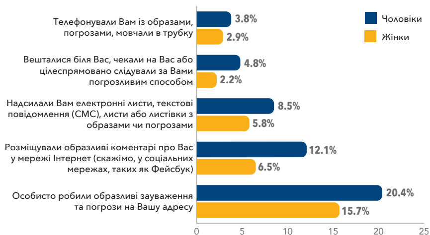
Рисунок 1. Відсоток єврейських чоловіків та жінок, які зіткнулися з різними видами антисемітських інцидентів за минулі 12 місяців. Респондентів запитували, чи ставались із ними зазначені вище інциденти