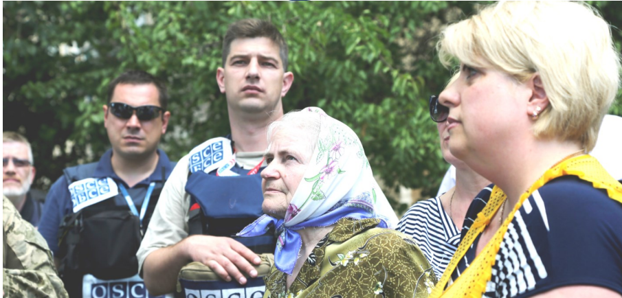
Спостерігачі СММ спілкуються з мирними жителями Красногорівки, Донецька область, 21 червня 2017 року