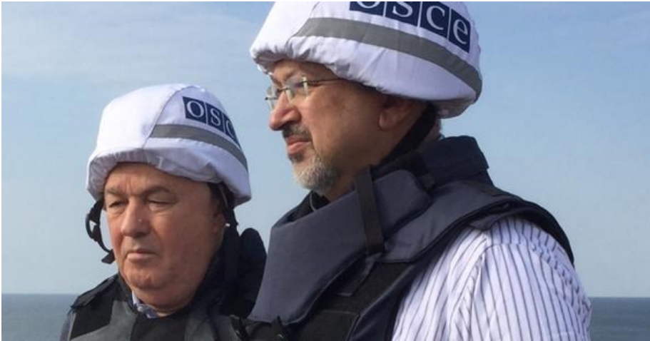
Голова СММ Ертурул Апакан та Генеральний секретар ОБСЄ Ламберто Заньєр на спостережному пункті біля Широкиного, вересень 2015.