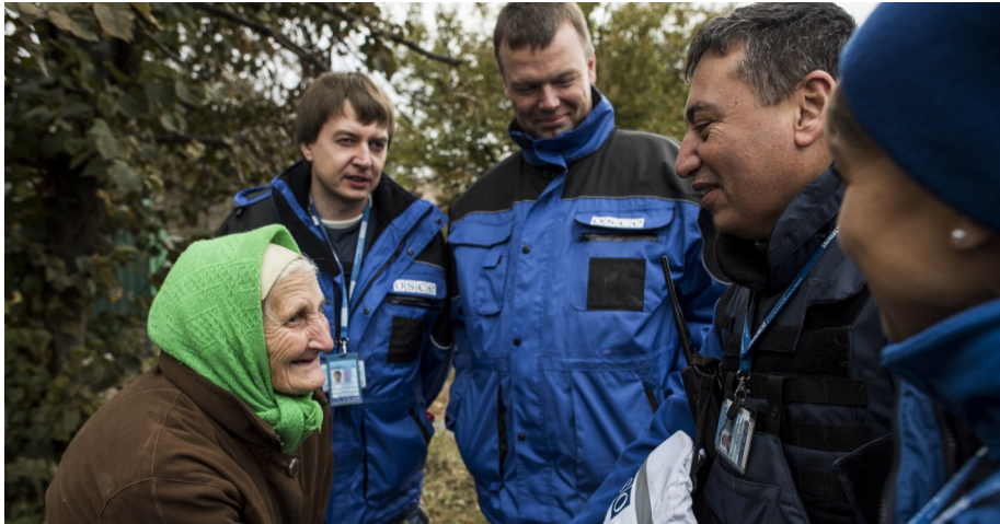
Спостерігачі СММ ОБСЄ зустрічаються з жителями села Піски, жовтень 2015.