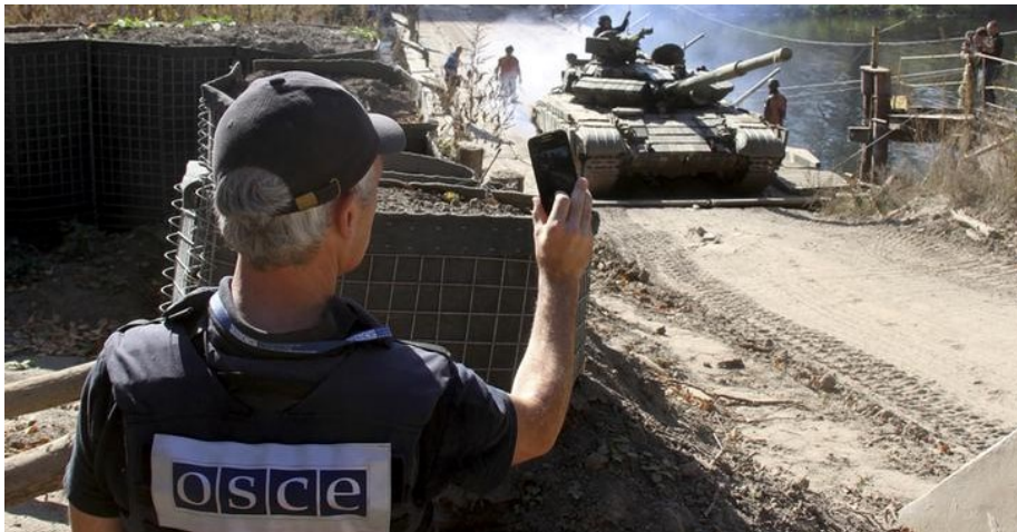
СММ ОБСЄ моніторить відведення танків у Луганській області, 5 жовтня 2015.