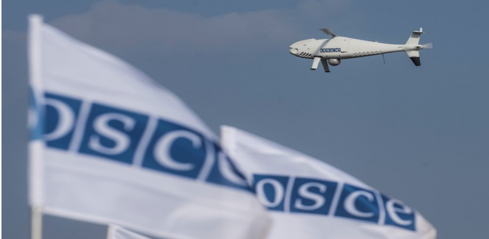
Безпілотний літальний апарат СММ дальнього радіуса дії