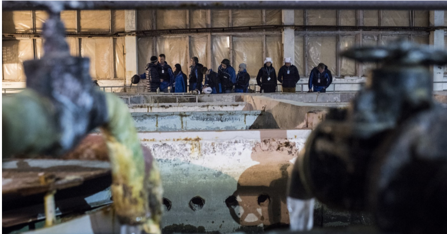
СММ сприяла і здійснювала моніторинг відновлення роботи Ясинуватської фільтрувальної станції, 17 березня 2016 р.