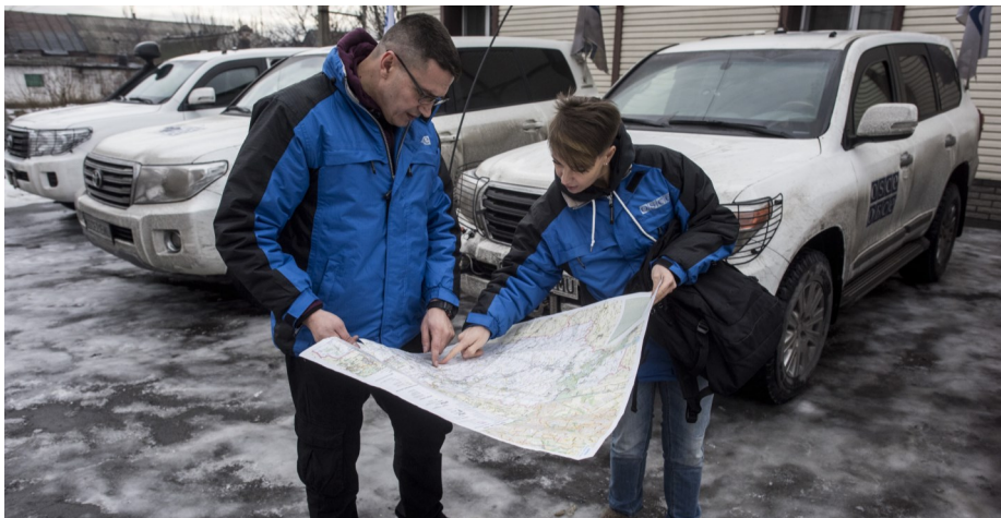
Наблюдатели ОБСЕ готовятся к патрулированию, 14 января 2016 года.