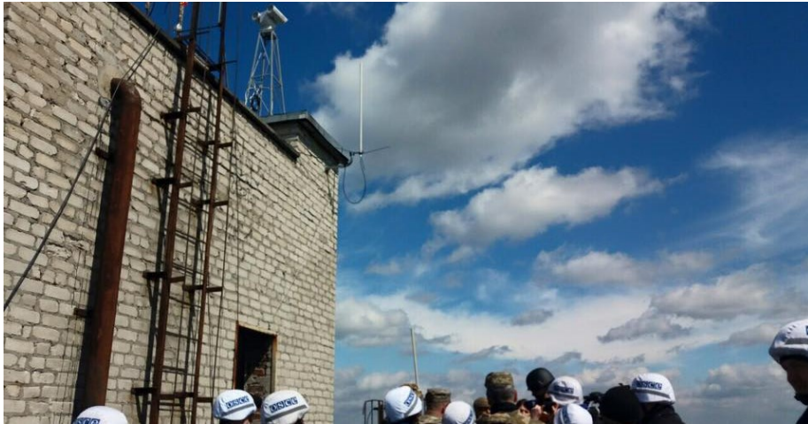
СММ ОБСЄ встановила дві камери: одну в Авдіївці й одну на шахті «Жовтневий рудник», квітень 2016 р.