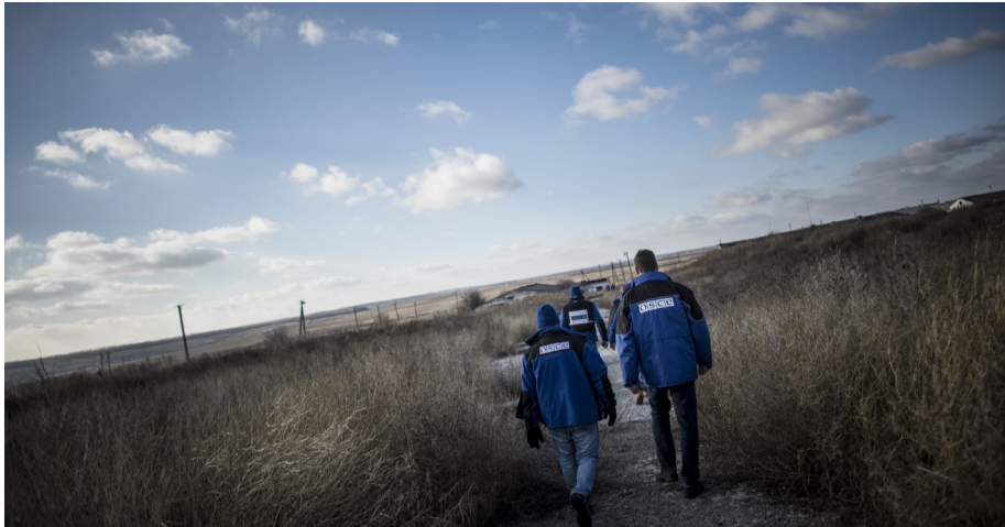
Спостерігачі СММ здійснюють піше патрулювання, грудень 2015.