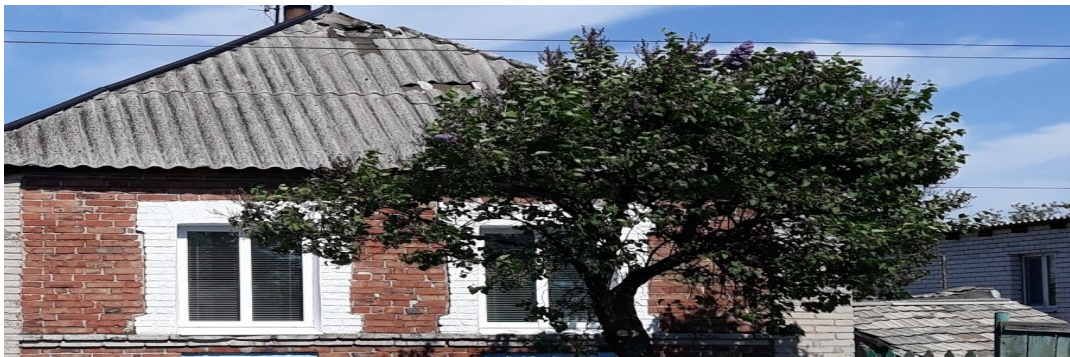
Поврежденный вследствие обстрела жилой дом в Авдеевке Донецкой области