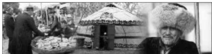
Сцены повседневной жизни в окрестностях Оша: продавец лепешек; у входа в юрту, в ожидании плова; торговец шапками (подробности см. в статье).

Письменный разговор о жизни в Центральной Азии может не так уж