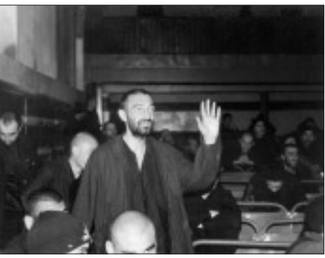
Заклученные в Кошкской колонии (Армения) участвуют в диспуте о своих человеческих правах.

Второе обсуждение данного отчета было организовано в Бюро ОБСЕ в Ереване с участием представителей международных организаций: Агентства США по международному развитию, института «Открытое общество», организации «Призов реформ интер-