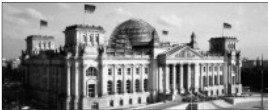
Здание рейхстага в Берлине, где размещен общепарламентский парламент Германии, стало местом проведения единственной ежегодной сессии Парламентской ассамблеи ОБСЕ.

тами, выступили председатели Румынии Ион Илиеску и спикер сената Николае Вакарэу. В числе участников конференции были Председатель ПА ОБСЕ Адриан Северин, председатель Парламентской ассамблеи Совета Европы Петер Шилдер, первый заместитель председателя комитета по иностранным делам Европейского парламента баронесса Эмма Никольсон, Специальный координатор Пакта о стабильности для Юго-Восточной Европы Эрхард Бусек, спикер парламента Македонии