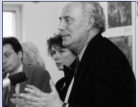
«Когда та или иная страна ошущает себя в состоянии войны, первой жертвой становится свобода слова». Фраймут Дуве [из Ежегодника «Свобода и ответственность» за 2001 год].

Материалы всех четырех разделов логически подводят к итоговому об-