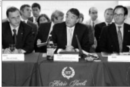
На совещании в Лиссабоне Тройку ОБСЕ представляли (слева направо): министр иностранных дел Румынии Мирча Джоанэ, министр иностранных дел Португалии Антониу Мартинш да Круз и генеральный директор по политическим вопросам министерства иностранных дел Нидерландов Хуго Сибле.

варе высказала намерение созвать такое совещание, дающее возможность подвести итог работе, проделанной различными организациями по вопросам безопасности после 11 сентября 2001 года. Это должно способствовать лучшему согласованию их планов, равно как и заострить внимание на таких традиционных направлениях деятельности ОБСЕ, как поддержка и защита прав человека и укрепление верховенства закона.