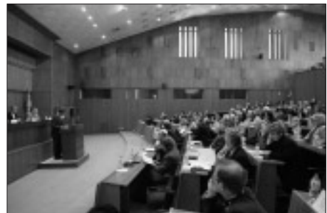
Скупщина Косово: высший представительный и законодательный временный орган самоуправления Косово.

17 ноября 2001 года жители Косово отдали свой голос за 120 депутатов скупщины края, которая согласно Конституционной структуре является высшим представительным и законодательным временным органом самоуправления Косово». 4 марта с. г., после достиже-