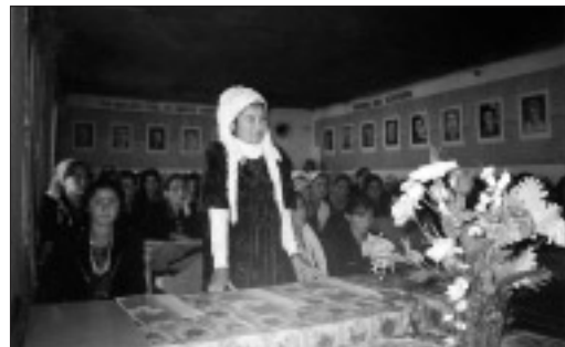
Школьники из сельских и горных районов Таджикистана с энтузиазмом относятся к перспективе получения высшего образования.

Для обсуждения некоторых из этих проблем в середине мая были органи-