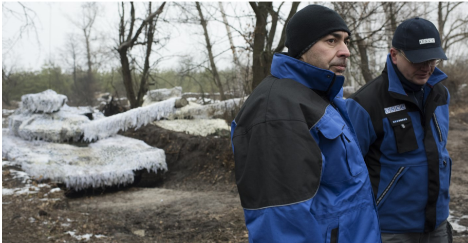
Наблюдатели СММ посещают место постоянного хранения вооружения, ноябрь 2015 г.