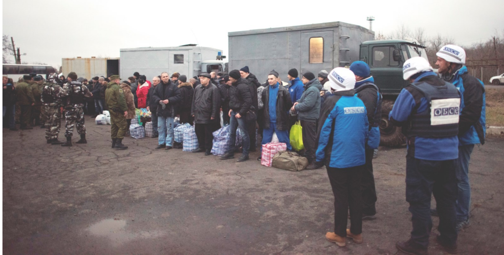
Спостерігачі СММ ОБСЄ під час обміну утримуваними особами, 27 грудня 2017 року.