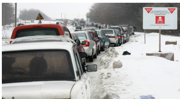
Предупредительный знак о минной опасности возле неподконтрольного правительству блокпоста «Кременец», январь 2019 г.

Несмотря на обязательства извлечь все ранее установленные мины согласно пункту 6 Меморандума от 19 сентября 2014 года и Решению Трехсторонней контактной группы относительно противоминной деятельности от 3 марта 2016 года, которые четко предусматривают обозначение, ограждение и составление карт местности возле КПВВ и вдоль подъездных дорог, СММ продолжает фиксировать наличие мин и неразорвавшихся боеприпасов в этих районах. Миссия фиксировала знаки, которыми были обозначены минные поля или участки, загрязненные минами и неразорвавшимися боеприпасами, вблизи КПВВ и соответствующих блокпостов, однако необходимо принять больше мер, направленных на надлежащее обозначение загрязненных районов, в частности между передовыми позициями Вооруженных сил Украины и вооруженных формирований.