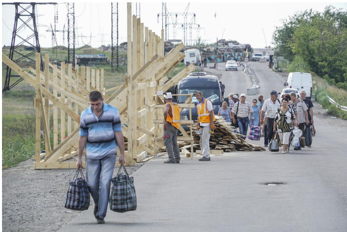
Граждане с сумками проходят мимо передовой позиции ВСУ возле КПВВ «Марьинка», июль 2018 г.