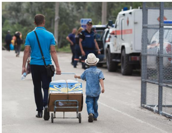
Мужчина с мальчиком пересекают мост возле КПВВ «Станица Луганская», август 2019 г.

Многие уехали, другие остались по разным причинам, в частности из-за работы, недостатка средств или необходимости заботиться о членах семьи с проблемами опорно-двигательного аппарата. В августе 2019 года в подконтрольной правительству Авдеевке наблюдатели встретились с мужчиной, который уже несколько лет не видел своих внуков, проживающих в Донецке. Он объяснил, что до конфликта они с женой добирались в Донецк за 15 минут, однако сейчас им бы пришлось ездить через КПВВ «Марьинка», тратя на это целый день. В сентябре 2019 года на мосту возле Станицы Луганской 40-летняя учительница английского, которая возвращалась в Луганск после посещения свекрови в подконтрольных правительству районах, рассказала команде Миссии, что мирные жители надеются, что вскоре отремонтируют мост и они смогут чаще посещать родственников с другой стороны линии столкновения.