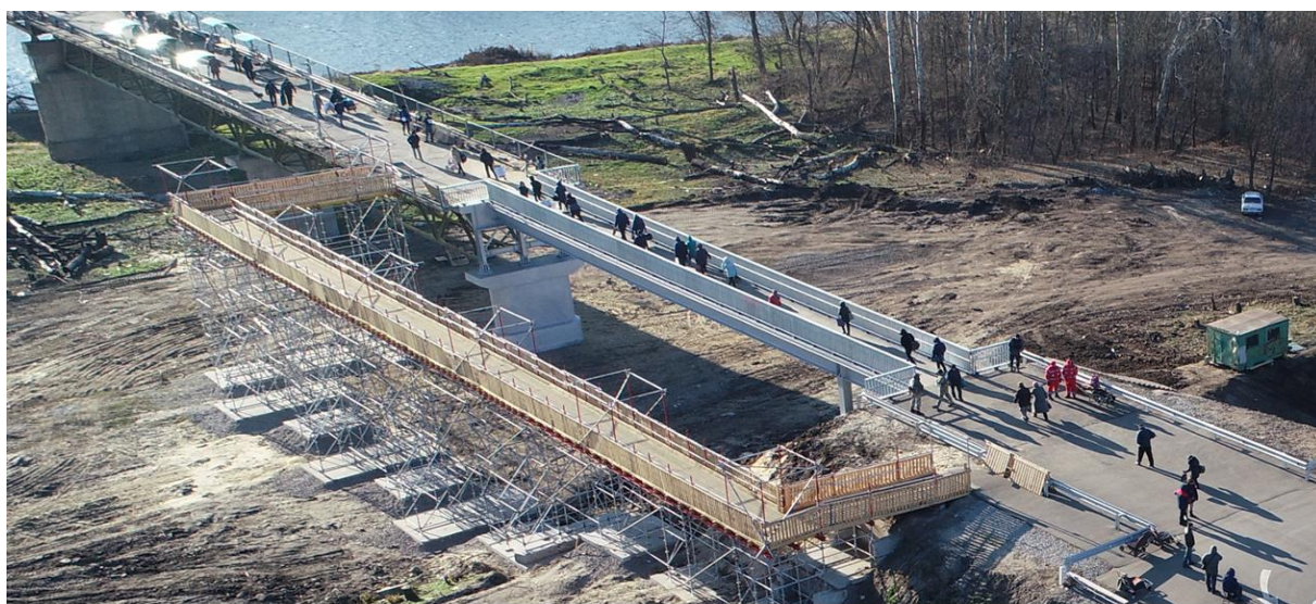
Участок разведения в районе Станицы Луганской Луганская область 21 ноября 2019 года Материалы фотофиксации мини-БПЛА

4 октября 2019 года для пешеходов открыли временный обходной мост (шириной 2,3 м) на период проведения украинской стороной ремонтных работ на разрушенной секции моста 51 . Обходной мост позволяет гражданам осуществлять переход по ровной поверхности впервые с момента, когда был разрушен мост. 20 ноября была открыта отремонтированная секция моста. Люди с проблемами опорно-двигательного аппарата сейчас могут перемещаться в креслах-каталках или на костылях, и им не приходится подниматься и спускаться по крутым деревянным трапам над разрушенной частью моста.