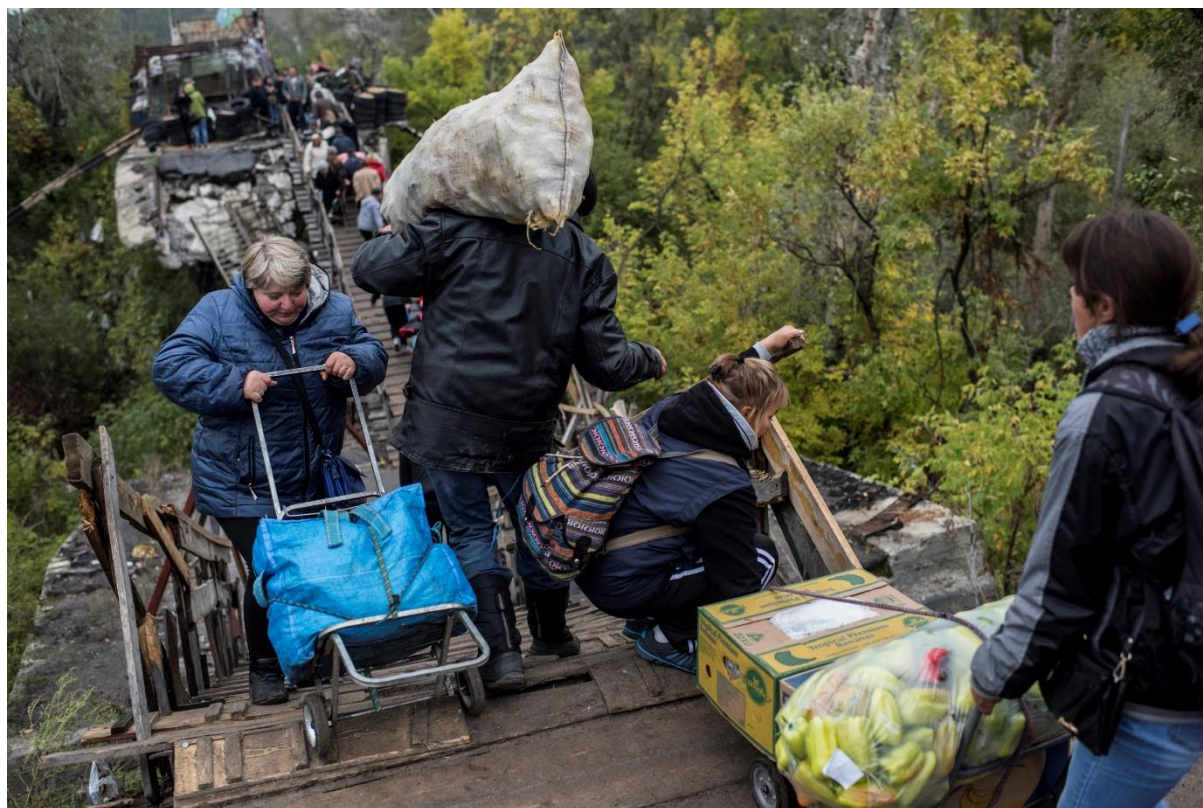
Разрушенная секция моста возле Станицы Луганской до проведения ремонта, апрель 2019 г.