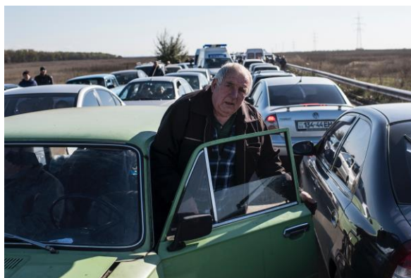
Мужчина в своей машине ожидает въезд на КПВВ «Марьинка»

Гражданские лица выражали обеспокоенность отсутствием укрытий для защиты от погодных условий во время ожидания, нехватку скамеек, контейнеров с системами обогрева/охлаждения, где можно отдохнуть, а также недостаточным количеством и часто негигиеничными санитарными сооружениями, особенно в неподконтрольных правительству районах. Более того, мирные жители сталкиваются с трудностями, когда перевозят товары через линию соприкосновения или при пересечении блокпостов без действительных документов.