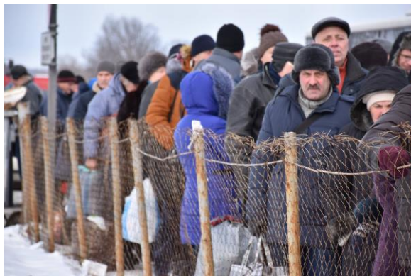
Люди в очереди на КПВВ «Марьинка», январь 2019 г.

Длинные очереди связаны преимущественно с ограниченной пропускной способностью КПВВ и соответствующих блокпостов, в том числе из-за небольшой численности персонала и нехватки технических средств для осуществления контрольно-пропускных процедур. По наблюдениям СММ, пять КПВВ и соответствующие блокпосты имеют разную пропускную способность. При этом по сравнению с неподконтрольными правительству блокпостами (за исключением Оленовки) на КПВВ больше кабинок/окон для проверки 36 . Миссия зафиксировала