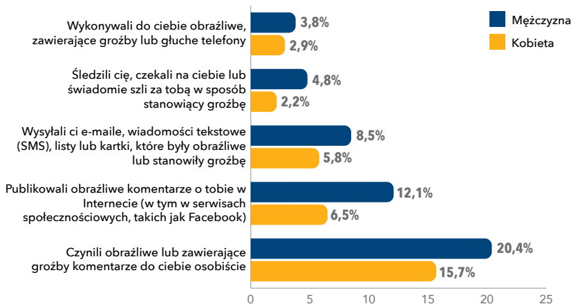
Rysunek 1. Proporcje żydowskich mężczyzn i kobiet, którzy doświadczali różnego rodzaju incydentów antysemickich w ciągu ostatnich 12 miesięcy. Ankieterom zapytano, czy doświadczali powyższych incydentów.

Poniższe wykresy, zaczerpnięte z tego samego badania, ilustrują, jak antysemityzm może w różny sposób wpływać na mężczyzn i kobiety.