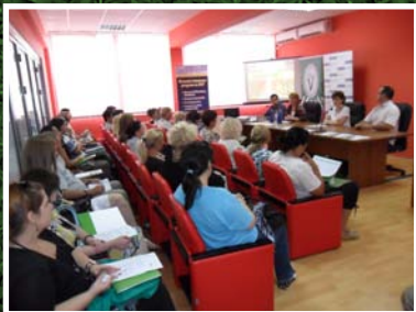
Kragujevac - Biznis inovacioni centar