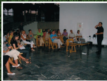
Čačak - Dom kulture