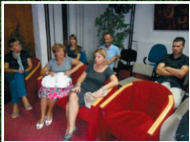
Arandelovac - Skupština opštine