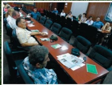
Raška - Skupština opštine