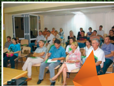
Paraćin - Skupština opštine