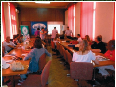
Kruševac - Skupština opštine