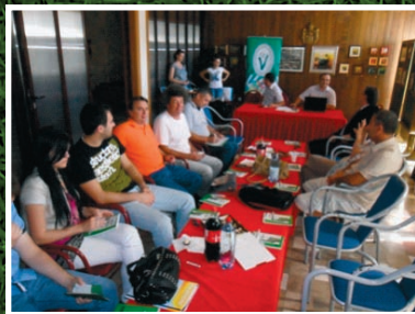
Prijepolje - Dom kulture