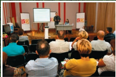
Šabac - Kulturni centar