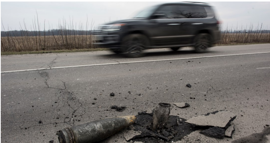
Невибухлий снаряд на сході України