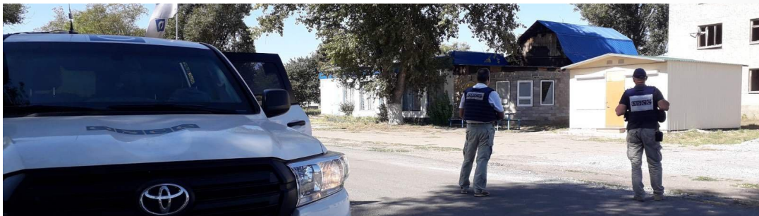
Наблюдатели СММ в Лебединском Донецкой области