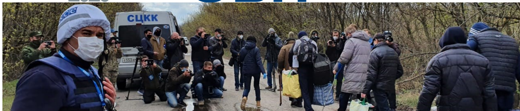
Спостерігач СММ спостерігає за взаємним звільненням та обміном утримуваних осіб поблизу Майорська