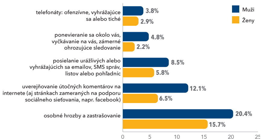
Graf 1. Podiel židovských mužov a žien, ktorí za uplynulých 12 mesiacov zažili rôzne formy útokov motivovaných antisemitizmom. Respondentom bola položená otázka, či zažili uvedené incidenty.