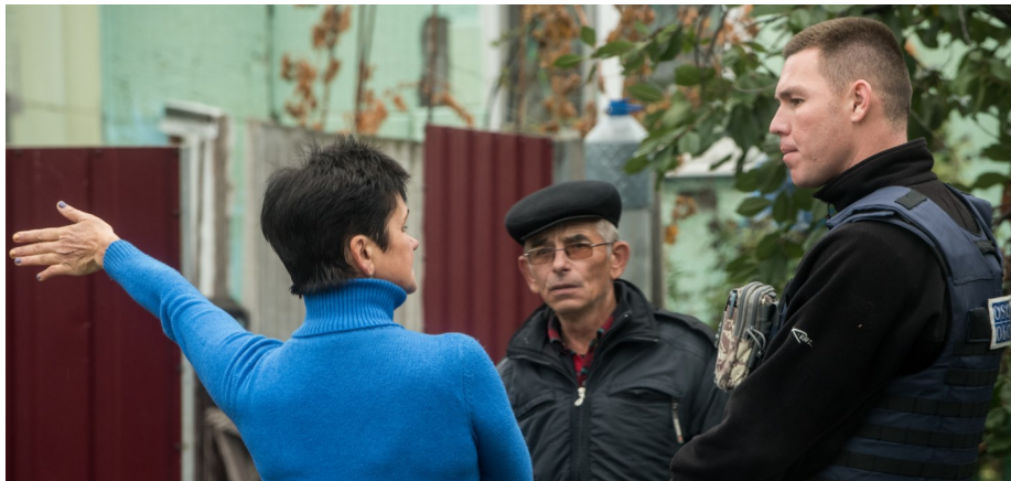
Спостерігач СММ ОБСЄ під час патрулювання у Верхньошироківському (фото Євген Малолітка/ОБСЄ).