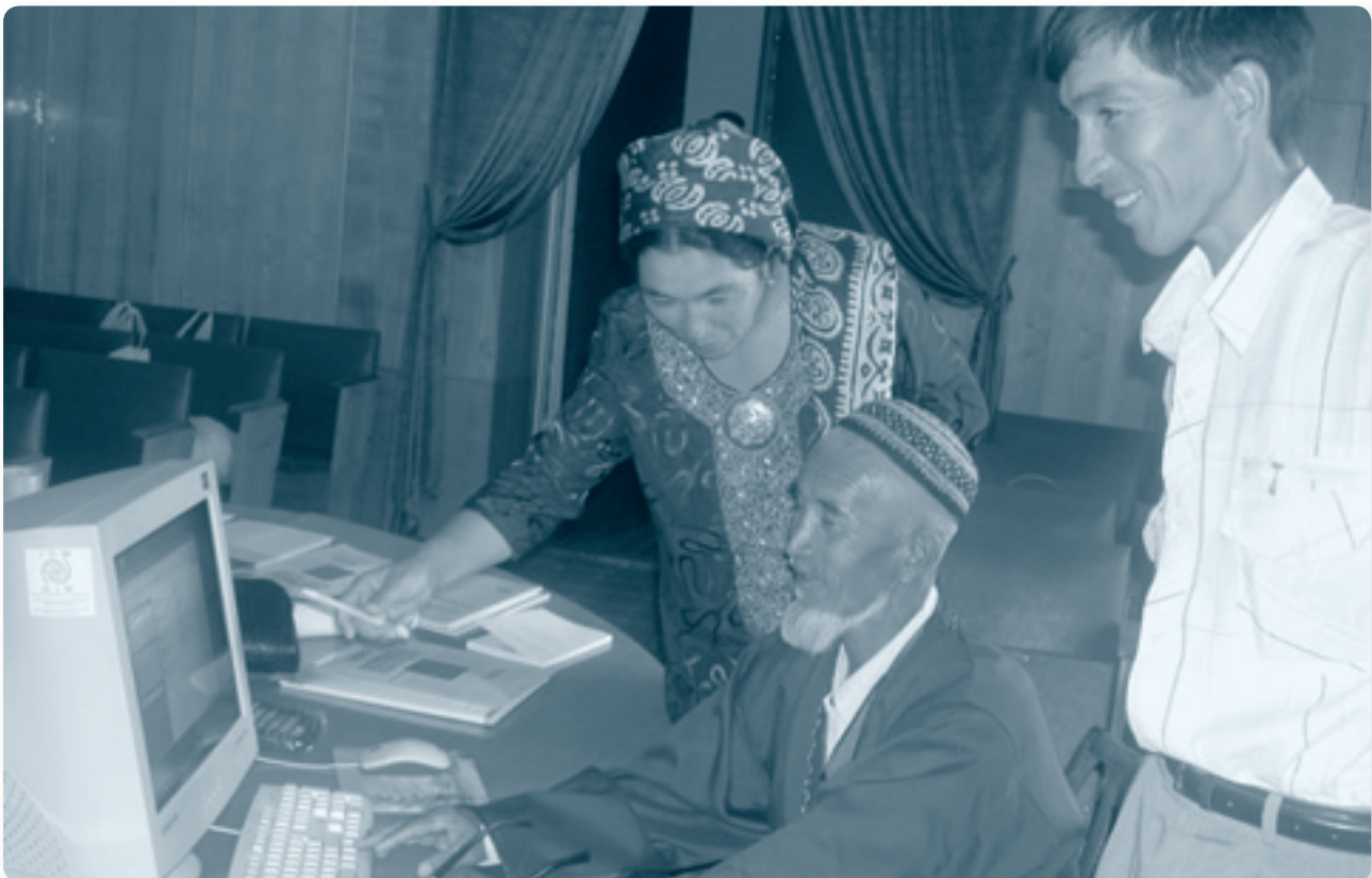
Члены добровольных фермерских ассоциаций во время обучения компьютерным и бизнес-навыкам

Участники представляли добровольные фермерские объединения (VFA) Туркменистана, участвующие в пилотном проекте по микрокредитованию, поддерживаемом Центром ОБСЕ в Ашгабате и ЕС ТАСИС. Проект оказал помощь при создании и финансировании четырех объединений в сельских районах Туркменистана. Проект обеспечивает способность объединений управлять оборотными средствами транспарентным и устойчивым образом для того, чтобы принести пользу своим членам и сельскому населению в целом.