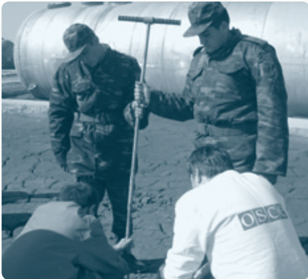
Для того, чтобы выяснить степень загрязнения почвы «Меланжем», берутся образцы почв. Хранилище «Меланжа», Азербайджан

Эксперты ОБСЕ посетили Казахстан в ноябре 2005 г. для определения количества и характеристик «Меланжа», имеющейся технологии переработки и оценки стоимости и временных рамок для переработки или уничтожения топливного компонента. В