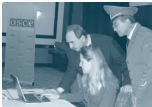
Австрийские эксперты с участником, представляющим Верховный Суд Туркменистана

институтов уголовного расследования и процедур, согласующихся с демократическими принципами прав человека и верховенства закона». Представители ОБСЕ и УНП ООН, а также эксперты из Австрии и Франции ознакомили с ключевыми международными инструментами и институтами борьбы с отмыванием денег и финансированием терроризма. Эксперты также помогли участникам определить потребности дальнейшего развития законодательства Туркменистана по борьбе с отмыванием денег и финансированием терроризма.