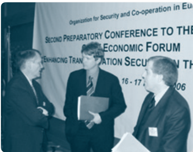
Обмен мнениями между участниками подготовительной конференции в Баку

Конкретные мероприятия последующей деятельности будут разработаны и выполнены после проведения Пражского форума.