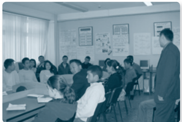
Семинары по расширению экономических возможностей молодежи в Кыргызстане

Второй успешный компонент проекта – совещание по обмену опытом для бизнес-инкубаторов южного Кыргызстана, проведенное 9 декабря 2005 г.