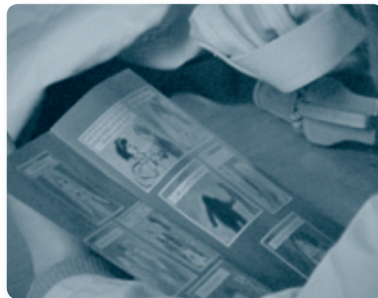
НПО "Women Wellness Centre" распространила предупреждение об опасностях стать жертвой торговцев людьми в виде комиксов, плакатов и брошюр

Миссия ОБСЕ в Косово также находилась в процессе завершения создания «Стандартных рабочих процедур для жертв незаконной перевозки и торговли людьми в Косово». Начиная с 2000 г. Миссия использовала межведомственный подход к разработке схем защиты. В этом году Миссия ОБСЕ в Косово, в сотрудничестве с местными партнерами, составила план деятельности, нацеленный на создание возможностей наделяния экономическими знаниями людей, пострадавших от торговцев людьми. Миссия ОБСЕ в Косово первоначально была вовлечена в усиление программ по защите, в то время как программы профилактики осуществлялись Министерством труда и социального обеспечения, Министерством молодежи, спорта и культуры и Международной организацией труда. Главными бенефициарами этих программ являются дети, цель программ - предотвращение наихудших форм детского труда.