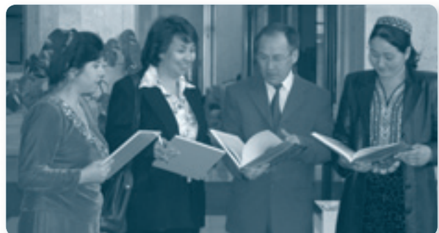
Туркменские участники из Министерства охраны природы с участниками конференции рассматривают Национальный план действий по охране окружающей среды и обмениваются мнениями

Более 80 представителей различных министерств, исследовательских институтов, общественных союзов и международных организаций со всех концов страны приняли участие в конференции по национальному плану действий по охране окружающей среды, проведенной 24-25 ноября 2005 г. в Ашхабаде. Двухдневная конференция под названием «НПДООС в действии» была организована Министерством охраны природы при поддержке Центра ОБСЕ в Ашхабаде. Участники обсудили выполнение работы в рамках Плана, который является руководством для выполнения государственной политики в области окружающей среды, принятой в 2002 г.. Эксперты и ученые рассмотрели большой круг важных вопросов, включая экологическую безопасность, проблемы бассейна Аральского моря и экологическое образование. Особый акцент был сделан на защиту водных и земельных ресурсов, биоразнообразия и агро-биоразнообразия и их связи с безопасностью человека, а также инвестиционную деятельность.