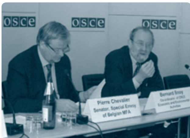
Г-н Пьер Шевалье, специальный представитель Министрства иностранных дел Бельгии, и г-н Бернар Снуа на 14-м Экономическом форуме в Вене