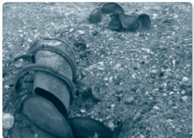
Свалка пестицидов в Канибадаме, Таджикистан

Партнеры ENVSEC в 2005 г. продолжили работу по оперативной оценке риска для окружающей среды и здоровья промышленных «горячих точек», ставящей своей целью понимание, мониторинг и контроль трансграничного загрязнения и риска для здоровья населения, вызванного промышленной деятельностью в Ферганской долине. Недавно в четырех выбранных местах, где существуют проблемы с окружающей средой, эксперты из Кыргызстана, Таджикистана и Узбекистана из экологических и промышленных организаций получили подготовку по методам оценки риска; им были предоставлены необходимые инструменты моделирования. Эксперты участвовали в совместных миссиях по оценке, в которых была собрана полезная информация о рисках для здоровья и окружающей среды, включая сбор образцов с полей и результаты бурения. Были предложены и обсуждены предварительные меры по рекультивации земель на месте. Следующие шаги включают моделирование оценки риска, предварительные планы нештатной ситуации для пораженных областей и предварительное технико-экономическое обоснование/рекомендации для мер по рекультивации земель и снижения установленных рисков.