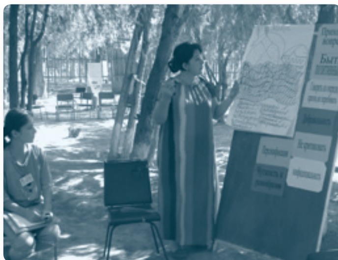
Худжандский экономический летний лагерь

По всей стране выполнялись небольшие проекты с целью знакомства с концепцией и принципами предпринимательства. Они включали в себя интенсивные летние бизнес-школы и лагеря для молодых людей в четырех регионах. Два таких мероприятия охватили молодежь из соседних стран – Кыргызстана и впервые - из Афганистана. Слава об успехе приграничного летнего лагеря в Бадахшоне должно быть распространилась среди афганских чиновников из северной части страны, результатом чего явилось обращение к нескольким НПО-партнерам ОБСЕ с просьбой организовать подобные лагеря и в Южном Таджикистане.