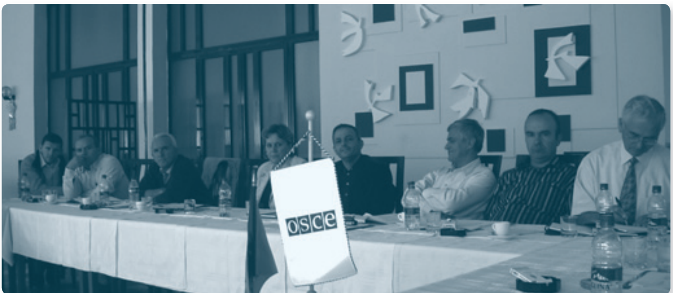
Семинары, повышающие потенциал албанских компаний в сфере понимания принципов ВТО и их применения в Албании

Миссия ОБСЕ в Албании (PiA), в сотрудничестве с албанскими консультантами и Торгово-промышленной палатой, организовала семинары в 12 албанских префектурах. В центре внимания - албанские фирмы, занимающиеся экспортом или импортом. Более 250 человек приняли участие в работе семинаров и почерпнули пользу от содействия, оказанного местному бизнесу. Фирмам была предоставлена информация о количественных и правовых аспектах албанского соглашения с ВТО, а также информация о последствиях и преимуществах данного соглашения. Проблемы фирм, высказанные на семинарах, были отражены в брошюре под названием «ВТО и албанский бизнес», подготовленной Албанским институтом государственной политики (AIPP) при поддержке PiA. Это пособие было подготовлено в сотрудничестве с экспертами из албанского Министерства интеграции; оно предоставило подробную и самую последнюю информацию о мерах, предпринятых Албанией в рамках соглашения с ВТО.