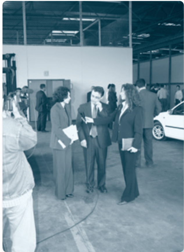
Административное здание завода ИМТ, в котором расположен БИЦ Княжевач