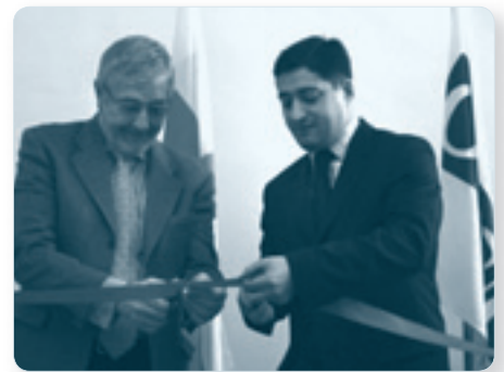
Открытие Орхусского Центра в Грузии

Миссия ОБСЕ в Грузии открыла Орхус-центр в Тбилиси. Центр расположен рядом со зданием Министерства окружающей среды и работает для того, чтобы помочь Грузии осуществить свои обязательства в рамках Орхусской конвенции.