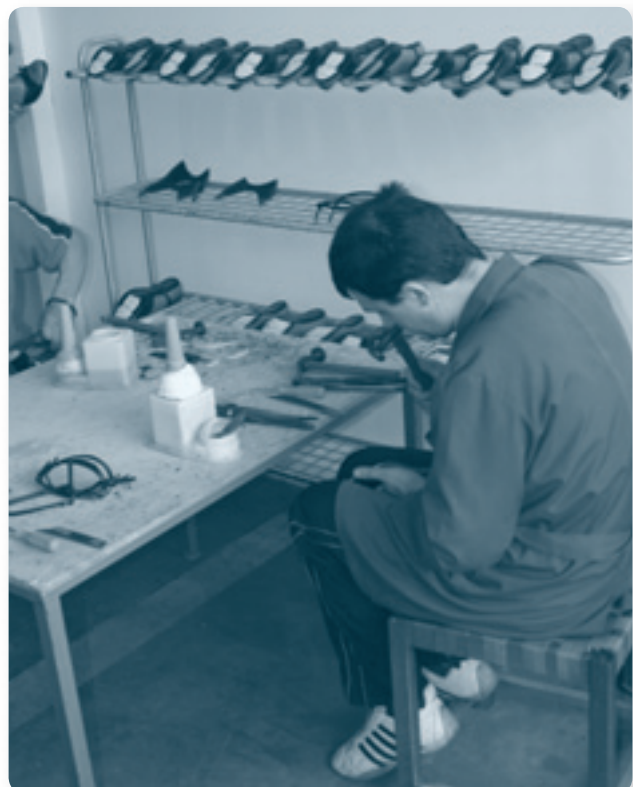
Мастер по изготовлению обуви из БИЦ Княжевач