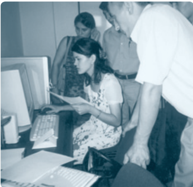
Демонстрация того, как использовать информационные технологии в финансовом менеджменте

В результате успешное завершение этого проекта принесло удовлетворение как Центру в Ташкенте, так и «КАМОЛОТ». В частности, пять участников проекта получили небольшие кредиты, в общей сумме составляющие более 12 млн. узбекских сомов (12 тыс. дол. США), двенадцать участников увеличили свой бизнес, семнадцать начали бизнес за счет собственных средств, а пятнадцать участников проекта нашли работу в бизнес-секторе.