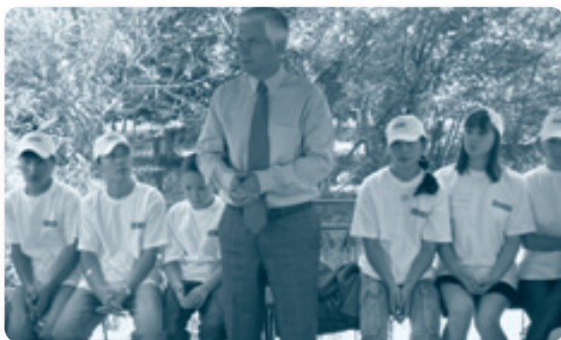
Посол Вики с детьми в летнем лагере по радиологической безопасности

Одним из регионов, представляющим высокий экологический и социальный риск, является территория, окружающая бывший Семипалатинский ядерный полигон. В советское время информация о нем была недоступной; после независимости практически единственным источником информации были СМИ, которые давали по большей части сенсационную и противоречивую информацию. Центр ОБСЕ в Алматы работает над этим вопросом с 2004 г., когда он проводил информационную кампанию о радиационной защите для людей из 28 поселков.