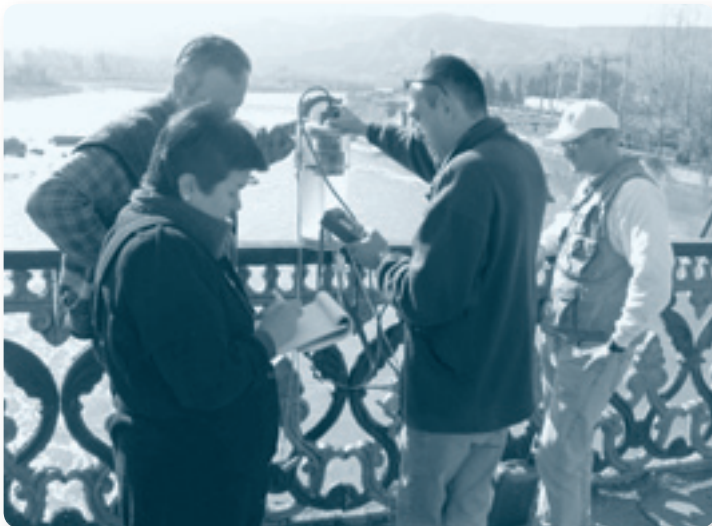
Эксперты с сотрудниками ОБСЕ берут образцы воды в Грузии

Региональные семинары собрали представителей НПО из всех Закавказских стран для обмена информацией и обеспечения вклада в скоординированные программы международного водопользования во всем регионе. Для своего форума НПО собрали вместе положения о речном бассейне Куры-Аракса, поддержанные на региональной встрече НПО в Грузии в июне 2005 г. Выполнение сопутствующего проекта о региональных водоносных горизонтах началось весной 2006 г.