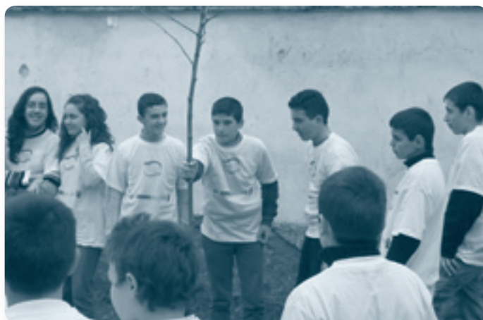
Студенты, приверженные задаче повышения экологической осведомленности среди учащихся своих школ

Проект, рассматриваемый в качестве долговременной инвестиции, нацелен на молодежь, которая в будущем сможет содействовать управлению городских отходов для чистых городов путем передачи этих навыков и культуры местным сообществам. Проект влияет на каждодневный опыт учащихся в их отношении к управлению утилизации отходов через 1) внедрение и установление новой системы сбора отходов в шести пилотных школах Тираны; 2) образовании эффективной системы переработки бумажных отходов; 3) кампании по повышению осведомленности как неотъемлемой части школьной программы по экологическим вопросам.