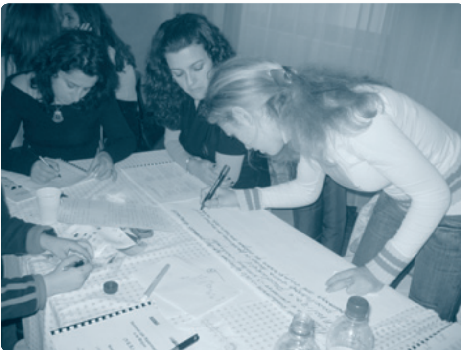
Молодые женщины - участницы находят применение своим предпринимательским навыкам при разработке местных бизнес-планов в Северной Албании

После успешного осуществления трех раундов семинаров по молодежному предпринимательству (Программа YES) в 2005 г. и в предыдущие годы в рамках деятельности по МСП, Бюро и отдел по экономике и экологии миссии ОБСЕ в Албании договорились о целевом проекте для уязвимых групп населения как средстве обращения к экономическим корням торговли людьми. Совместно с Агентством технического сотрудничества Германии (GTZ) и при финансовой поддержке Правительства Дании и ОБСЕ (в рамках АТП) проект