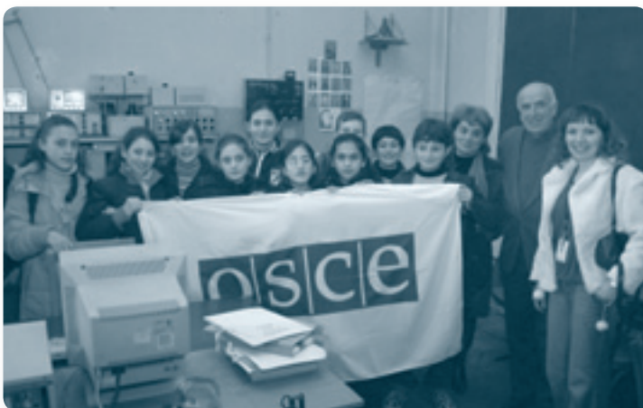
Школьники и ученые Тбилисского университета, занимающиеся наблюдением за рекой

Миссия ОБСЕ в Грузии поддержала совместную инициативу ОБСЕ, НАТО и Тбилисского государственного университета по мониторингу экологических параметров реки Куры - главной трансграничной реки на Южном Кавказе. Данные с мест мониторинга были переданы Армении и