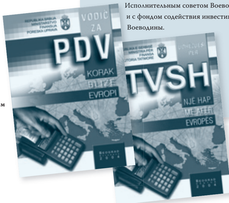
«Руководство по НДС» - обложки версий на сербском и албанском языках

«Руководство по НДС» представляет собой важный инструмент для экономического интегрирования меньшинств в общество. Оно было переведено на албанский и венгерский языки и опубликовано в форме буклета на двух языках (на албанском и сербском, а также на венгерском и сербском). «Руководство по НДС» было передано в отделы по обработке государственных доходов в Буяноваче, Пресево, Медведья, Лесковаче, Вранье, Нови Пазаре и Кральево, т.е. в муниципалитеты с большой численностью албанского населения. Версия Руководства на венгерском языке была распространена через отделы по обработке государственных доходов в муниципалитетах с большой численностью венгерского населения. Содействие выпуску буклета было организовано в сотрудничестве с Исполнительным советом Воеводины и с фондом содействия инвестициям Воеводины.