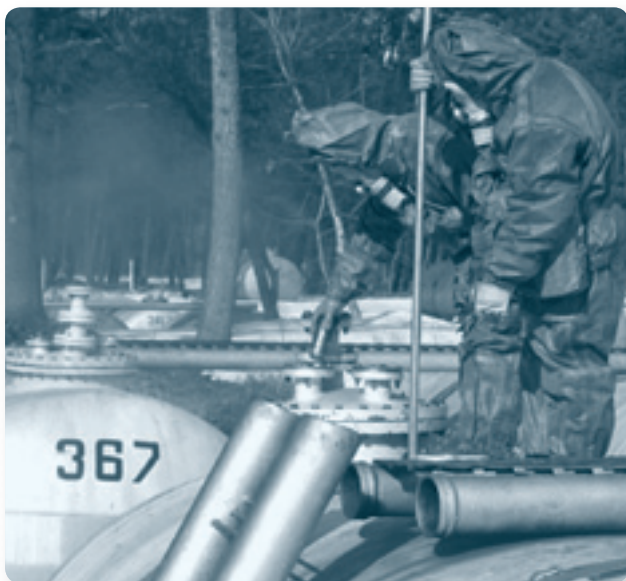
Инспекция места хранения «Меланжа» в Радехове, Украина

политические, гуманитарные и социально-экономические вопросы, как нельзя больше иллюстрируют важность «всеобъемлющего» подхода ОБСЕ к безопасности.