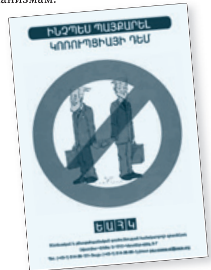
Пособие ОБСЕ по борьбе с коррупцией на армянском языке

В 2005 г. Офис ОБСЕ в Армении оказал поддержку перевода пособия ОБСЕ по борьбе с коррупцией на армянский язык. Версия пособия на армянском языке была представлена и распространена на семинаре ОБСЕ по антикоррупционному законодательству и механизмам.