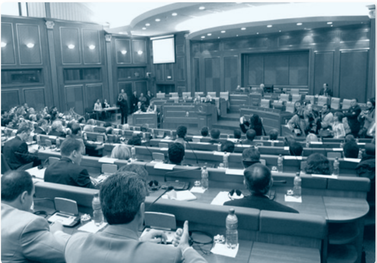
Миссия ОБСЕ в Косово содействовала процессу, приведшему в конечном счете к принятию принципиально нового законодательства и созданию солидной правовой базы для экономического развития Косово.

Пятьдесят менеджеров-руководителей из наиболее успешных МСП в Чачаке приняли участие в обучении, имеющем своей целью подготовить участников к повышению конкурентоспособности своих предприятий, таким образом содействуя общему экономическому развитию Сербии. Обучение было частью стратегии по повышению потенциала, сегментом Стратегии по устойчивому развитию муниципалитета Чачак.