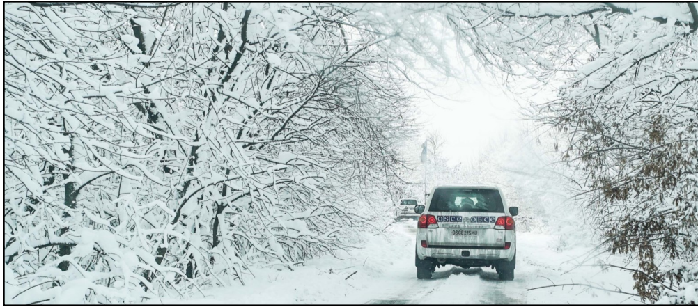
ОБСЕ СММ во время патрулирования возле Дебальцево, 25 ноября 2017 г.