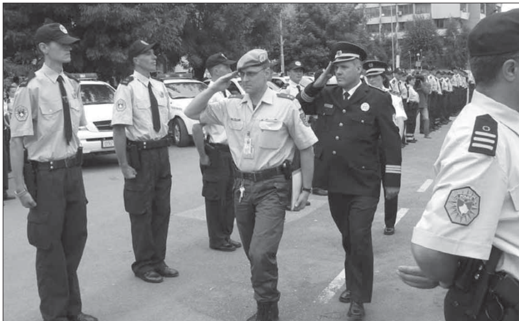
Ceremonia e dorëzimit të kompetencave SHPK-së nga UNMIK-u

Të gjitha shqyrtimet vjetor të IPK-së do të përmbledhen në një Raport Vjetor të Performancës së ShPK-së. I paraparë të jetë dokument publik, Raporti vjetor do t'i prezantohet PSSP-së, ministrit të punëve të brendshme dhe komisionarit të policisë. Raporti do të përmbajë informata faktike rreth performancës së ShPK-së,