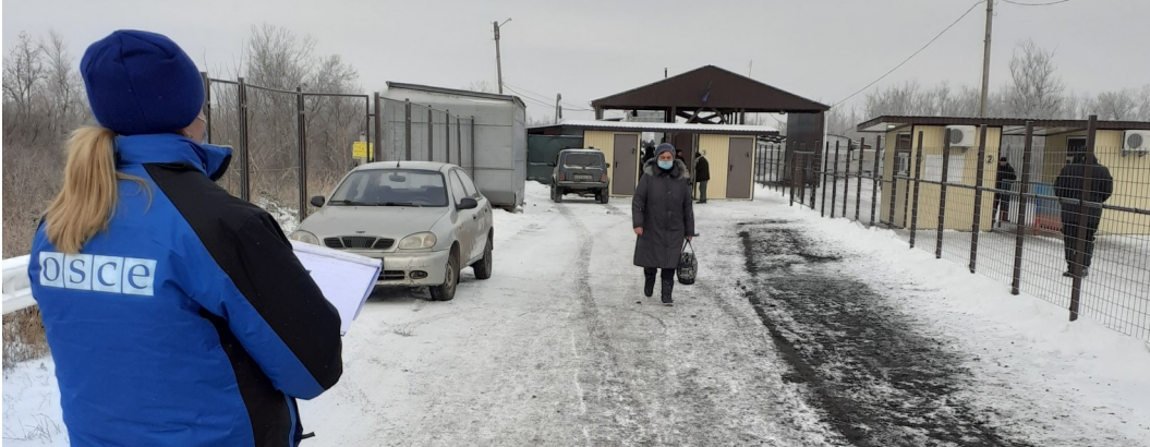
Спостерігачка СММ на контрольному пункті в'їзду-виїзду у Станиці Луганській, Луганська область (ОБСЄ/Бреннан Дейтан)