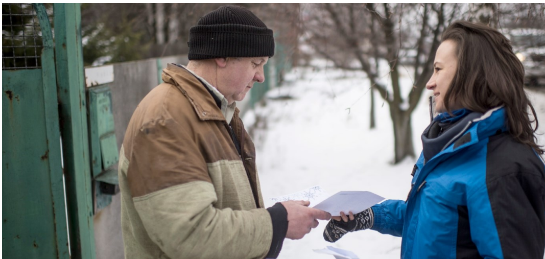
Співробітниця СММ ОБСЄ (праворуч) спілкується з мешканцем Мінерального, Донецька область, 19 лютого 2018 року.