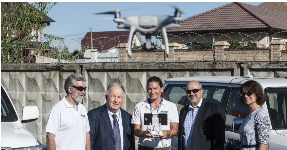
Спостерігач СММ демонструє використання БПЛА Генеральному секретарю ОБСЄ та Голові СММ ОБСЄ, Краматорськ, Донецька обл., 8 вересня 2016 року.