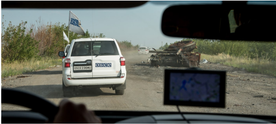
Патруль СММ следует по дороге М03 между Светлодарском и Дебальцево, 8 августа 2017 года.