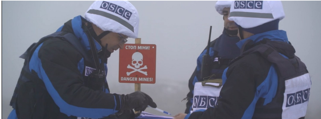
Спостерігачі СММ у Луганській області