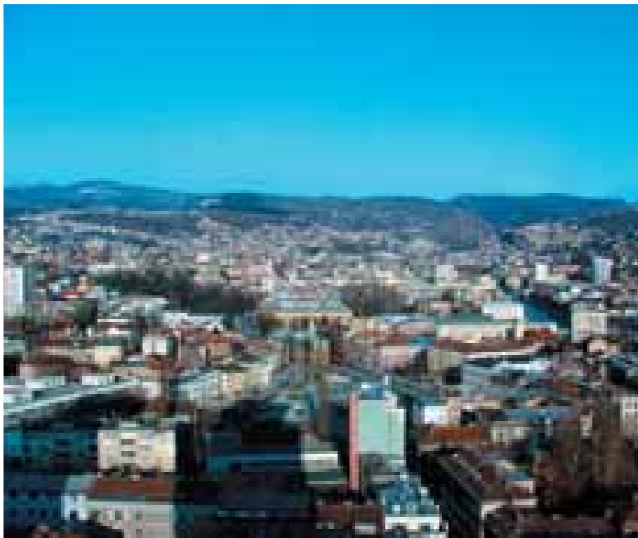
Atëherë dhe aty ku autoritetet vendore mohonin të bashkëpunonin, Përfaqësuesii i Lartë i largonte zyrtarët që pengonin apo edhe ua ndalonte atyre pjesëmarrjen në zgjedhje. Sarajeva kryeqyteti i Bosnës dhe Hercegovinës

Bosna dhe Hercegovina kanë bërë zotimin para Këshillit të Evropës për implementimin e ligjeve pronësore. Progresi i bërë ka qenë vërtetë i rëndësishëm, më tepër me meritën e autoriteteve vendore, mbi të gjitha të njerëzve të Bosnës dhe Hercegovinës. Disa patën thënë se duhet të kalojnë 40 vite ose edhe më shumë, por ja ku jemi, tetë vite më vonë, në prag të përfundimit të kapitullit të dhimbshëm në historinë e vendit. A është vendi më afër Evropës? Pra, kur flasim për standardet, Bosna dhe Hercegovina ka vendosur parmakët shumë lartë për fqinjët në Evropën jug-lindore dhe, në të vërtetë për tërë Evropën.