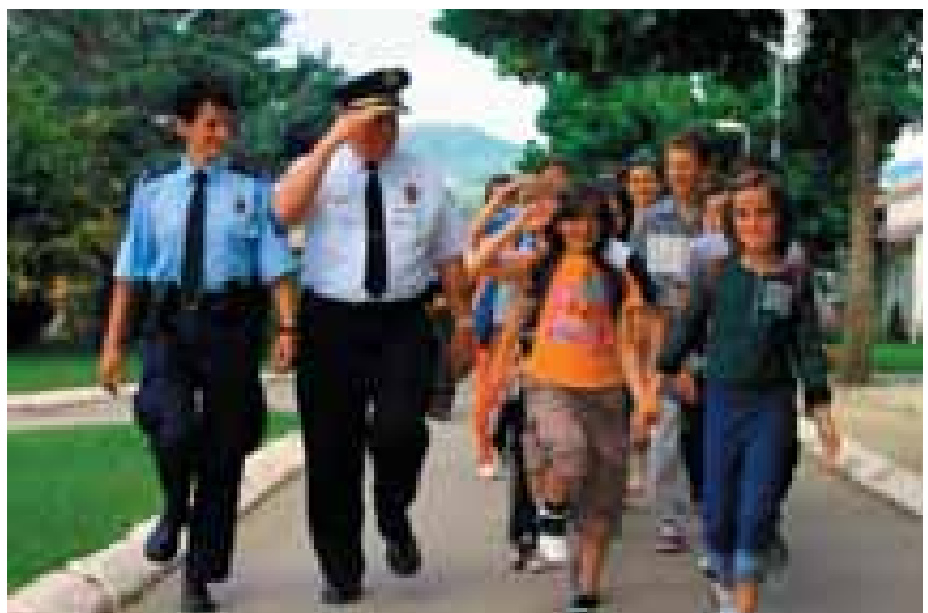
Fëmijët duke bërë marshin e SHPK-së, të cilët u kënaqën me 'policinë'

SHPK-ja është përpjekur të ndihmojë fëmijët, veçanërisht në fshatrat malorë të Kosovës ku disa fëmijë kishin ndërprerë shkollimin për shkak të kushteve ekonomike. "Ne u ndihmuam atyre të kthehen në shkollë, thjeshtë me nga një palë këpucë të reja që ata nuk kishin mundësi t'i blenin," shton me emocion z. Samjuëls. "Janë gjëra të vogla por që kanë peshë të madhe".