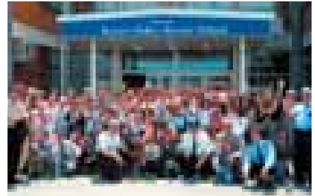
Fotografia e përbashkët me kadetët të SHPK-së

Vizita e fëmijëve vazhdoi edhe në pjesë të tjera të shkollës. Interesante ndër to ishte vizita në palestren sportive të SHPK-së, ku fëmijët për së afërmi patën rastin t'i shohin disa ushtrime psikofizike, nëpër të cilat kalon çdo kadet i SHPK-së.