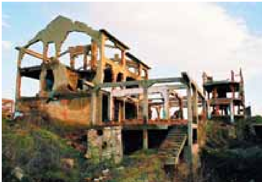
Errësira buzë qytetit. Kjo pamje e zbehtë e bënë të vështirë të kuptosh se si ishte jeta e qindra familjeve që para lufte jetonin në 'Rrugën e Fabrikës'

Përderisa DRC-ja dhe komuna ende mendojnë për mahallën, kushtet momentale të jetesës së personave të zhvendosur nuk janë fare të mira. Nëse i vizitoni kampet e personave të zhvendosur në Zhitkoc (Zvečan), Cesmin Lug (Mitrovicë) ose Leposaviq është sikur ke hyrë në një botë tjetër, jo vetëm në një shtrirje të ndryshme kuturore, por në një hapësirë me varfëri të madhe. Qindra familje që jetojnë në baraka kanë kushte të mjerueshme. Hapësira është e kufizuar, ajrosja e dobët, dhe qasja për punësim, arsimim dhe shëndetësi është duke u zvogëluar. Ata i pranojnë vizitorët vendor dhe ndërkombëtarë me një pikë dyshimi. UNMIK-u, përfshirë OSBE-në, UNCHR-i, Habitatit dhe një numër i madh i OJQ-ve i kanë vizituar ata gjatë pesë viteve