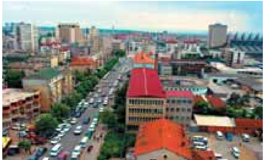
Pristina, kryeqyteti i Kosovës

Baza ligjore ekzistuese nuk ka mundur t'i parandalojë tërësisht fenomenet që kanë dëmtonuar pasuritë e patundshme të qytetarëve. Në Kosovë ka edhe disa vendbanime jozyrtare të banuara me bashkësi të cilat ndihen të rrezikuara. Të gjithë këto kanë bërë që standardi për të drejtën e pronës të fokusohet në katër elemente me të rëndësishme: