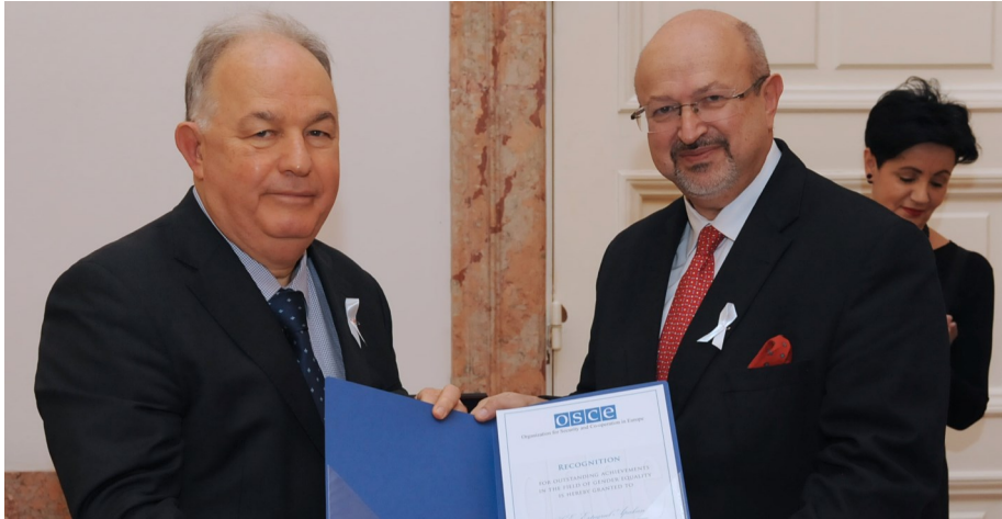
Глава СММ ОБСЕ, Эртурул Апакан (слева), получает памятную белую ленту, 1 декабря 2016 года.