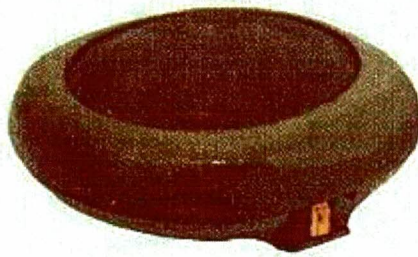
Mina antipersonal modelo P-5