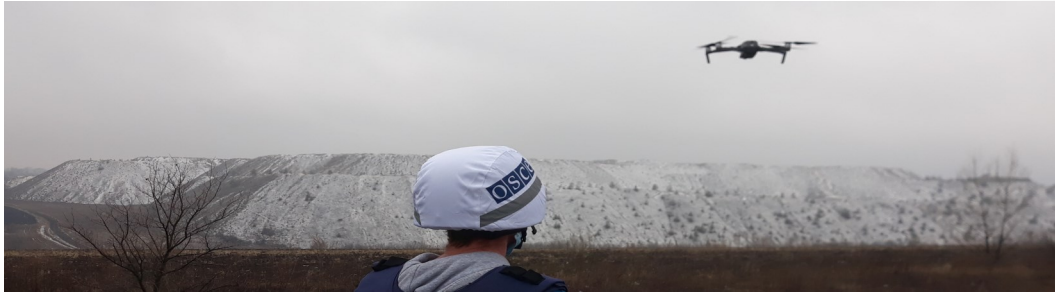
Патрулювання біля Сєвєродонєцька, Луганська область (СММ ОБСЄ)