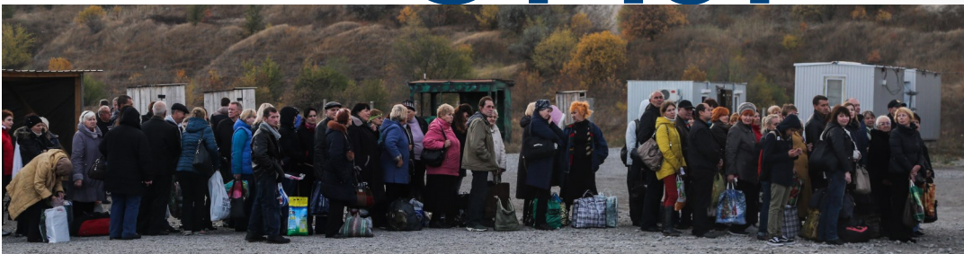
Гражданские лица в очереди на КПВВ «Новотроицкое» в Донецкой области