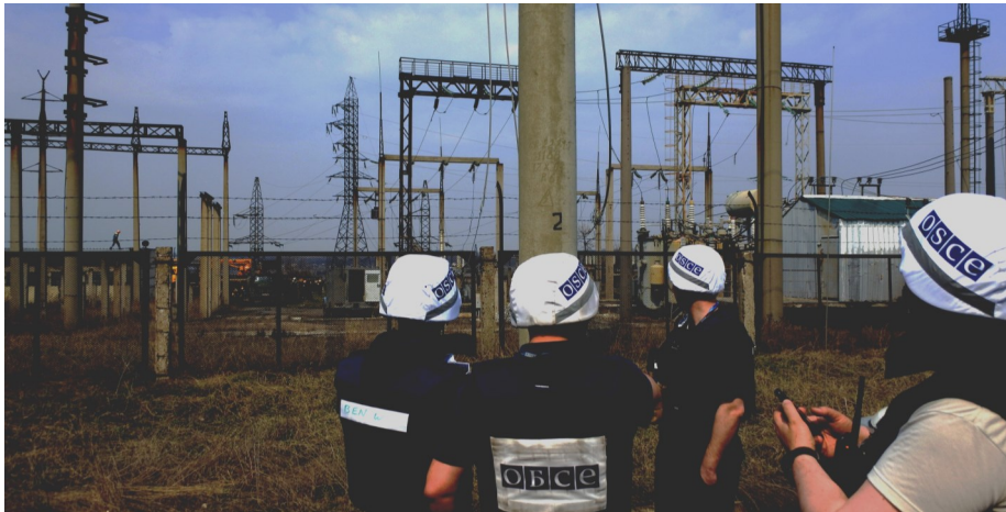
Наблюдатели СММ ОБСЕ содействуют установлению режима прекращения огня и осуществляют мониторинг его соблюдения для обеспечения возможности проведения работ по разминированию и ремонту линий электропередачи возле ДФС между Авдеевкой и Ясиноватой, 4 апреля 2017 г.