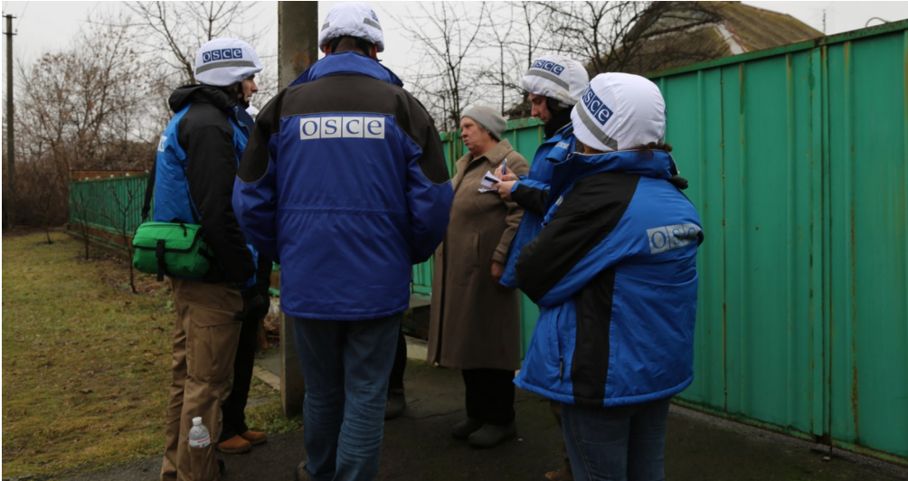
СММ ОБСЕ во время патрулирования в Травневом, 15 декабря 2017 года.